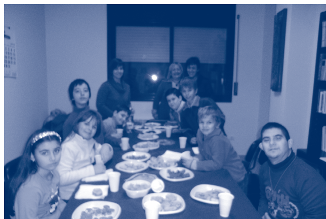
Berenar de Nadal amb els escolans (4/1/2011)