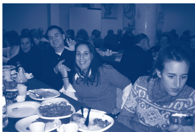
Sopar de Nadal dels col·laboradors voluntaris de la Parròquia (28/12/2010)