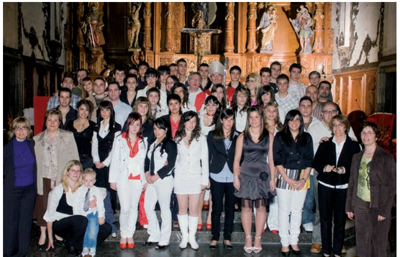
Confirmats, amb el Sr. Bisbe, el mossèn i els catequistes. Sentint la presència de l'Esperit Sant

Durant el mes d'abril, temps de Setmana Santa, al Centre Parroquial hi hagué una exposició de prop de tres-centes creus. Molta gent les contemplà i la col·lecció encara creix. El mossèn fent explicacions al Sr. Arquebisbe que visità l'esdeveniment.