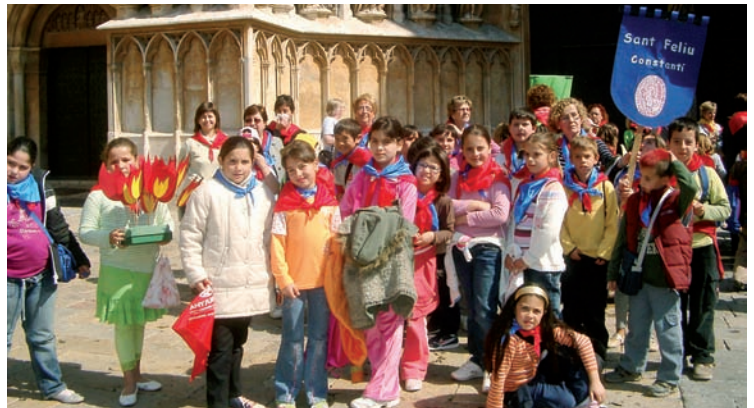
Ens infants de la Comunió, conjuntament amb els de l'Arxiprestat, participant ens els actes de l'Any Jubilar a Tarragona