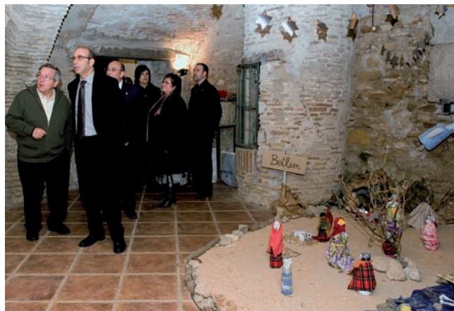
Pessebre amb material reciclat i la visita del Conseller del Medi Ambient