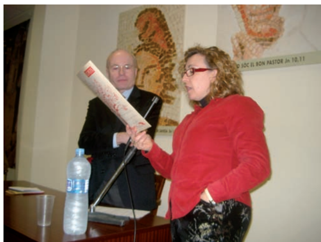
Els col·loquis amb ponents de gran interès i molt concorreguts. Una manera d'elevant el nivell cultural del nostre poble