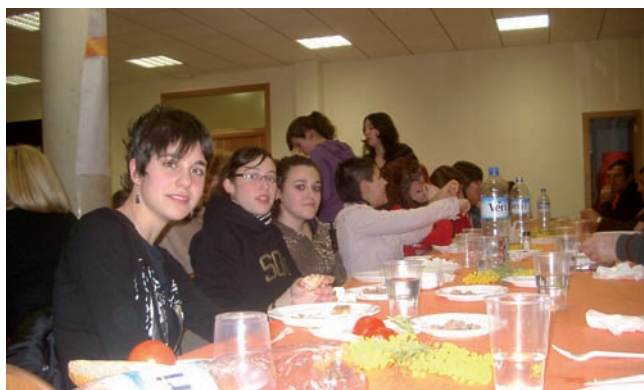
Sopant... el pa amb tomàquet...