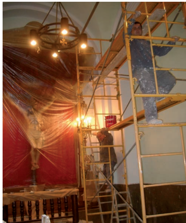
“La Capella” del Sant Crist, ha estat pintada. Era un del objectius de la Confraria.