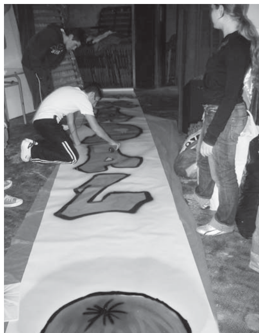
Una manera de felicitar el Nadal. Els de Confirmació fent el graffiti que està a la façana de l'Església