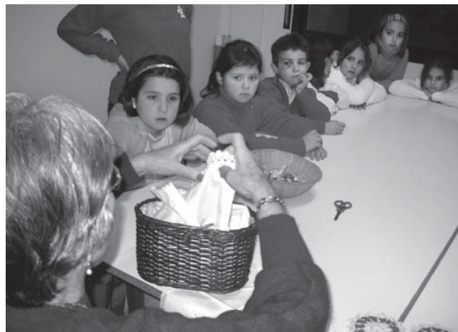
A l'Esplai les àvies també ensenyen i els petits s'encanten descobrint allò que era de sempre.