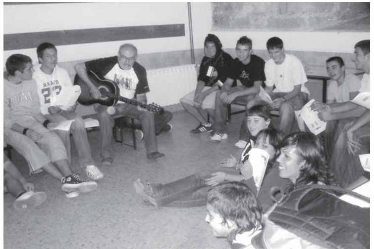
Un grup de catequesi de Confirmació de convivències a Vallfogona de Riucorb i a Guimerà

Sábado 15 y domingo 16 en la Iglesia Hasta al día 22 en las tiendas de alimentación que lo acepten