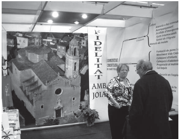
De nou la parròquia es va fer present a la Fira multisectorial. Una entitat diferent amb una presència diferent.