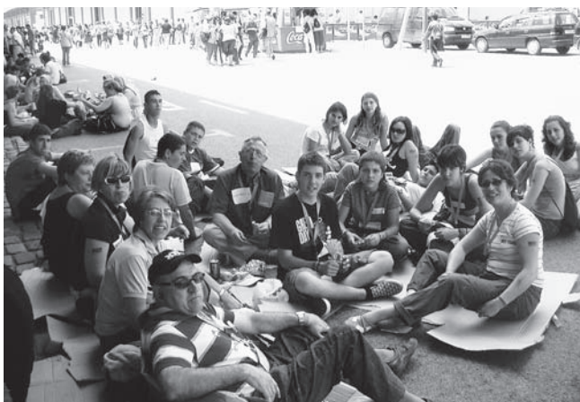
Joves i catequistes en la trobada de l'Aplec de l'Esperit.

Dels 5200 joves cristians que van trobar-se a Tarragona, 36 eren de Constantí: els de Confirmació, catequistes i voluntaris. Tot una festa, una experiència cristiana i un compromís a mantenir-se Marcats per l'Esperit. Conscients que vivim en un consumisme que ens marca una manera de fer, es vol plantar cara i dir en veu alta que hi ha un altre estil de reaccionar: deixar-se portar per l'Esperit. Va ser tot una trobada d'una extraordinària riquesa. Va fer descobrir que hi ha joves, hi ha Església, hi ha alternatives cristianes. Hi ha noves maneres de respondre a la crida que ens fa Jesús, que allibera de les falses maneres de muntar-se la vida.