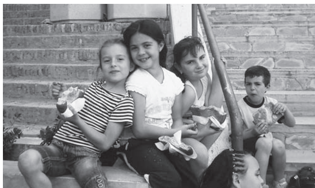
Infants 1a Catequesi, final de curs.